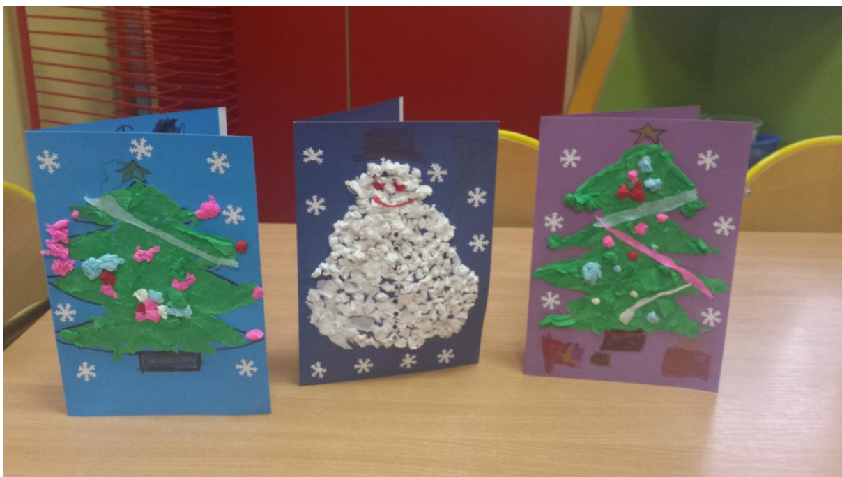
Kartki świąteczne w wykonaniu dzieci