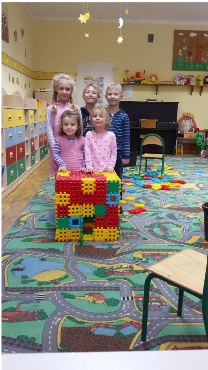
Swobodne zabawy w kąciakach tematycznych

W okresie jesiennym dzieci zapoznały się z nową porą roku oraz wzbogaciły swoje słownictwo poprzez nazwy zjawisk atmosferycznej oraz obserwowały zmieniającą się pogodę. Aby wzbogacić doznania uczniów często wybieraliśmy się na spacer w okoliczne miejsca i zbieraliśmy dary jesieni, z których następnie zostały wykonywane prace techniczne oraz ustrojone klasy.