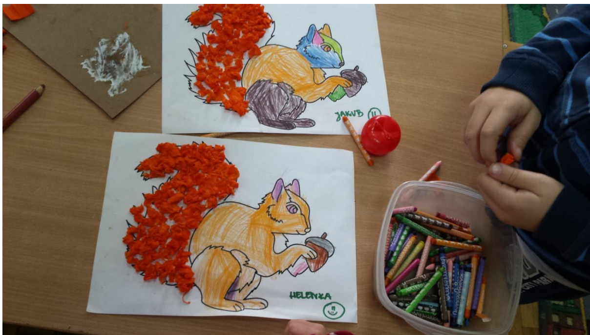
Praca „Jesienna wiewiórka”