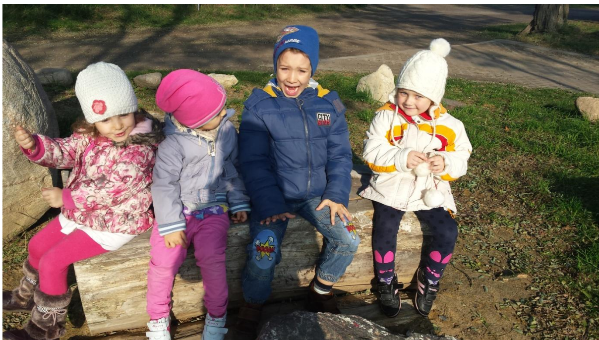
Spacer po bliskiej okolicy

Jedną z takich prac są kasztanowe ludziki, które sprawiły dzieciom dużo satysfakcji oraz szkoliły małą motorykę najmłodszych. Aby ustroić klasę zostały wykonane również sowy, które następnie zamieszkały świetlicowy parapet oraz kolorowe liście jesieni.